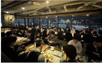
オーナー様同士も情報交換をされ、親睦を深めていました！

2024年12月10日、「年末オーナー様懇親会」を開催いたしました。4年ぶりの開催となった前回に引き続き、今回も多くのお客様にご参加いただきました。美味しい食事とお酒とともに大いに盛り上がり、皆様と貴重な時間を過ごすことができました。