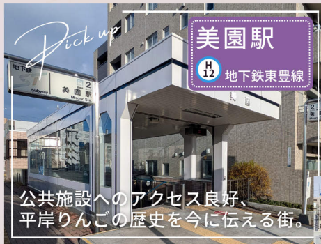
公共施設へのアクセス良好、平岸りんごの歴史を今に伝える街。

【所在地】札幌市豊平区美園8条6丁目3 【開業日】1994(平成6)年10月14日