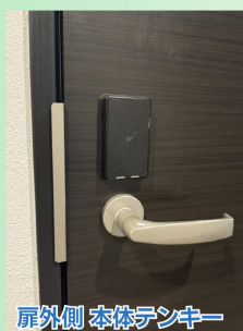
扉外側 本体デンキ

ICカードをかざす、スマートフォンアプリでボタンを押す、暗証番号を入力する、のいずれか3種類から好きな方法で解錠が可能になります。一時利用可能なデジタルキーを生成し、家族やゲスト、家事代行スタッフへ渡すことも可能です。スマートフォンアプリで開け閉めの履歴を確認することもでき、防犯面でも安心です。