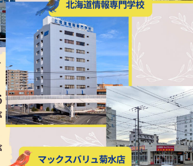
北海道情報専門学校

1976年に開業した菊水駅。大通へは地下鉄で2駅の近さであり中心部へのアクセスに優れ、駅上にはスーパーもあるなど買い物にも便利なエリアです。