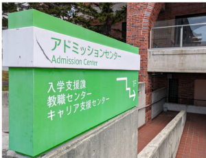
各大学の就職支援センターやキャリアセンターを訪問しました

2024年3月から開始したウィンドワードの2025年卒採用。新卒採用5期目を迎えた今期からは待遇面の見直しや新たな取り組みとして学校訪問を行いました。今回は、大きな転機ともなった2025年卒の採用活動を振り返りたいと思います。