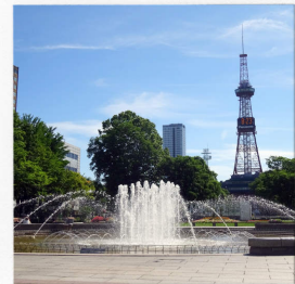
大通公園3丁目噴水

そんな大通公園は2025年には大規模改修が計画されています。報道によると公園を東1丁目まで延伸する案や駅前通と石山通を除く市道を廃止して公園を連続化させる案が出ており、多くの札幌市民に親しまれてきた公園がこれからどのように変化するのか今後も注目していきたいと思います。