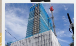
建設中のモイクサッポロ