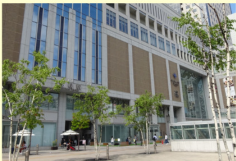
北海道の路線価最高額となったJR札幌駅南口の「札幌ステラプレイス前」

道内の最高価格は札幌市中央区北5条西3丁目の「札幌ステラプレイス前」で、1平方メートルあたり616万円。前年と比べて4.8%上昇し、道内最高額は17年連続。2031年春の北海道新幹線札幌延伸を控えて再開発計画が相次ぐ札幌駅周辺の地価は上昇傾向です。