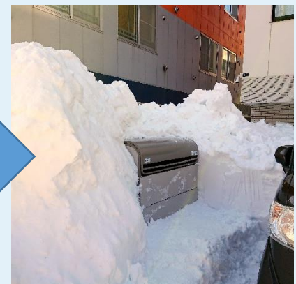
当社スタッフでの除雪作業後