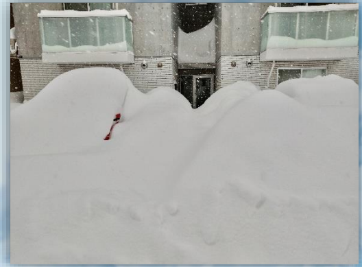
1日でエントランスを塞いでしまうほどの積雪

12月はじめまでは例年どおり雪が少なかったものの、12月後半から積雪が増え、2月には札幌市で24時間の降雪量が観測史上最多を記録しました。JRの全面的な運休など交通機関にも影響が出たほか、家庭ごみの回収が中止となるなど市民生活にも支障が出る事態となりました。