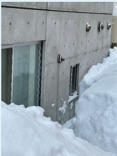
ストーブ排気口の除雪後

今後このような事態が発生した場合、迅速に対応できる体制基盤や各部門と連携した適切な人員配置など、雪トラブルへの備えの強化を図ってまいります。