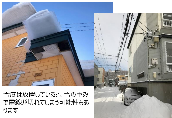
雪庇は放置していると、雪の重みで電線が切れてしまう可能性もあります

屋根や屋上に降り積もったこの雪の塊がどんどん大きくなると、建物からせり出すようになります。雪庇はそのまま放置しておくと重みに耐え切れずに地面に落下してしまいます。そうすると隣の家との境を雪で埋めてしまったり、さらには隣の家の窓ガラスを割ってしまうという事故も過去には発生しており、ご近所トラブルにもなりかねません。さらには、歩道に雪を落とし、交通の妨げになる、駐車場に停めてある車を傷つけてしまう、タイミング次第では、たまたま通りがかった人の上に落ちて大事故に…といった可能性もあります。